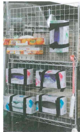
各セクションに設置した様子

100均で必要なアイテムを購入し、必要な箇所へ設置することで、台の上にペーパータオルそのものが置かれることはなくなりました。