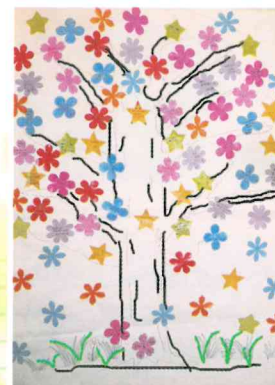
頑張ったメッセージの木

13:00～ 第1部 音楽発表会 13:20～ コーヒーブレイク 13:40～ 第2部 全員発表会 14:10～ 片付け