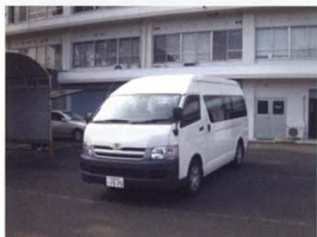
▲病院バス(トヨタハイエース名古屋200さ15-75)