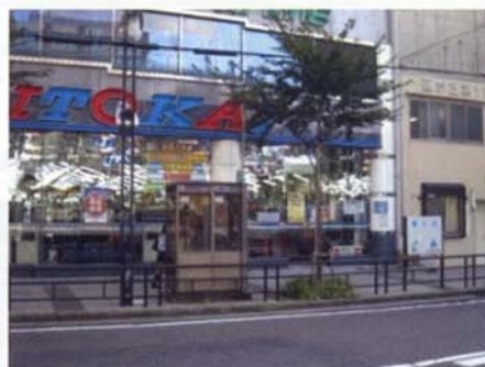
▲バス停②藤が丘駅西側パチンコ店前