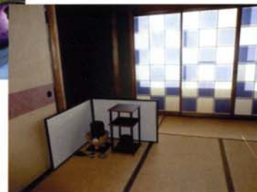
茶道を通じ、おもてなしを▶実践します。