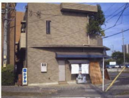
▲バス停①旭前駅東側タバコ屋前