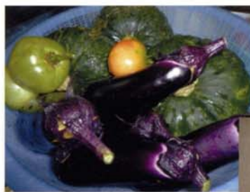
◀農耕で作った作物。皆で分けます。

デイケアでは、ご本人・主治医と相談しながら、その人に合った今後の生活を一緒に考えていきます。